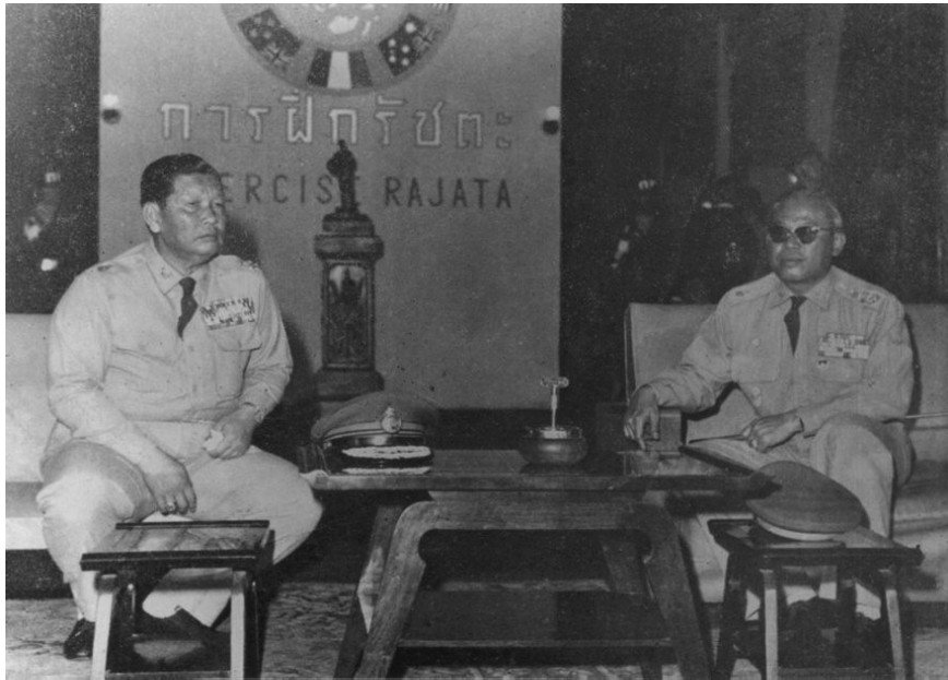
จอมพล สฤษดิ์ ธนะรัชต์ (ซ้าย) จอมพล ถนอม กิตติขจร (ขวา)