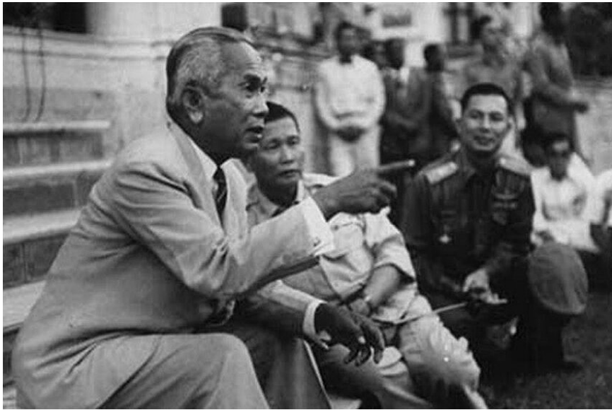
จอมพล สฤษดิ์ ธนะรัชต์ นำคณะนักศึกษาเข้าพบจอมพล ป. พิบูลสงคราม ที่ทำเนียบรัฐบาล หลังจากการเดินขบวนประท้วงการเลือกตั้งสกปรก พ.ศ. 2500 ก่อนการรัฐประหารไม่นาน